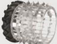
Dvojmontáž s ocelovými koly