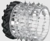
Dvojmontáž s ocelovými koly