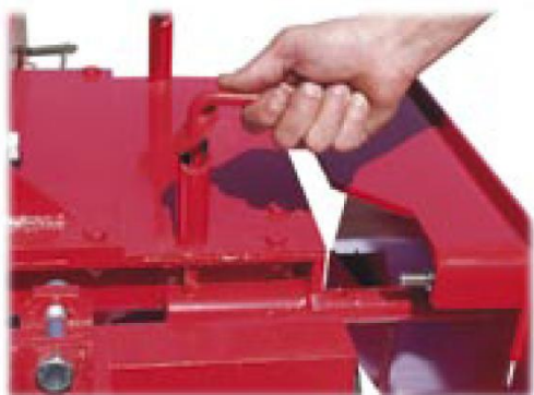
Jednoduchá manipulace pro nastavení pracovní šířky bez použití nástrojů